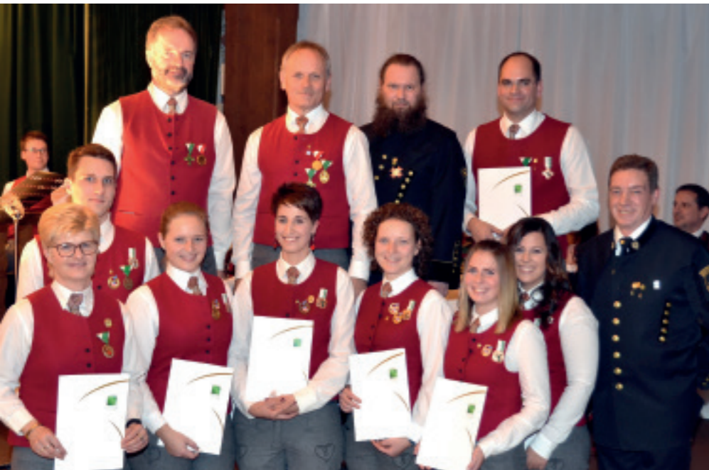
WEIHNACHTSKONZERT - Jungmusikerleistungsabzeichen Musikverein Weißkirchen