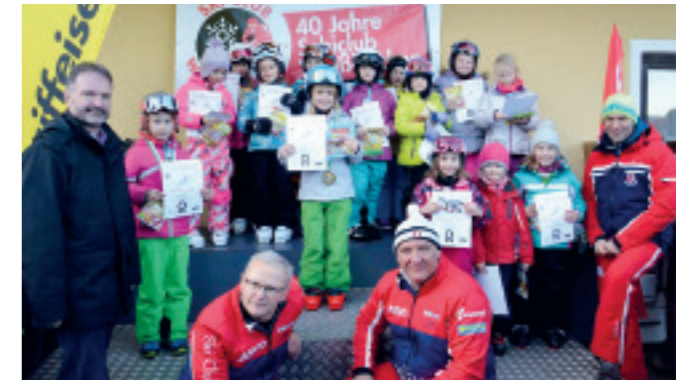
KINDERSCHIKURS in der Gaal