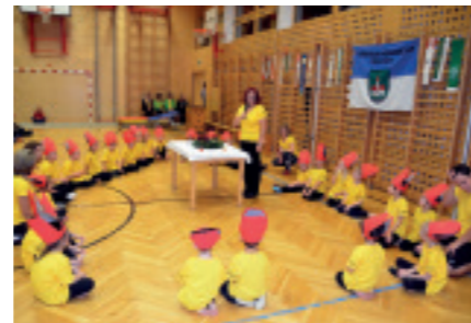
JULFEIER des Turnvereines Weißkirchen