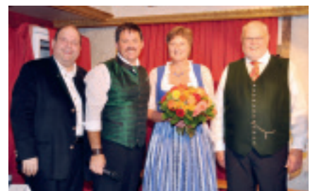
NEUE CHORLEITERIN für den Singkreis Eppenstein