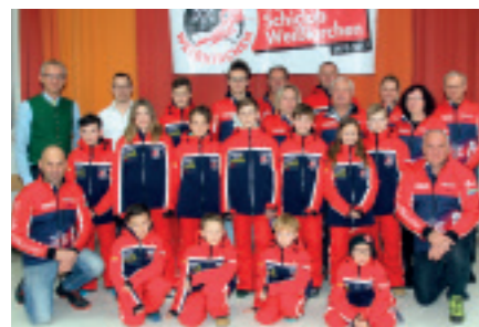
SCHICLUB Weißkirchen - neue Schianzüge