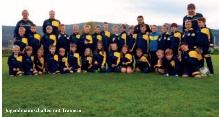
Jugendmannschaften mit Trainern

Der 1978 gegründete Fußballverein „FC Weisskirchen“ feiert heuer sein 40jähriges Bestandsjubiläum .