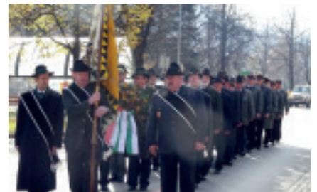
HELDENGEDENKFEIER des ÖKB Weißkirchen