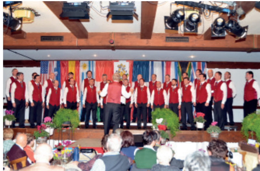
REISE UM DIE WELT – Konzert des MGV Weißkirchen