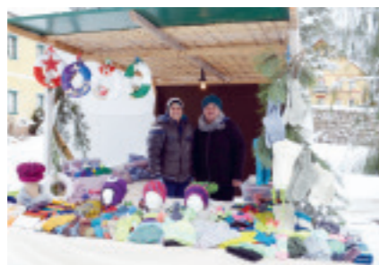
CHRISTKINDLMARKT in Kleinfelstritz