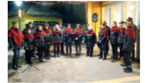
CHRISTBAUMSINGEN in Eppenstein