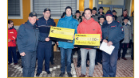
FRIEDENSLICHTAKTION mit Christbaumsingen