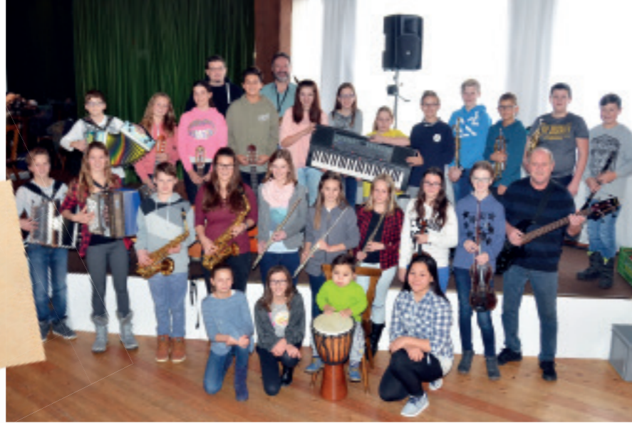
Die SPIELMUSIK der NMS Weißkirchen