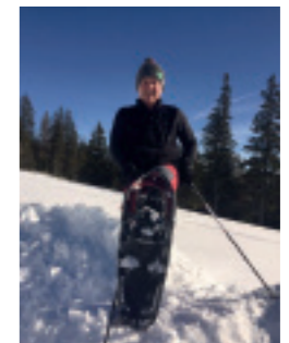
Auch Steiermark Tourismus Chef Erich Neuhold war zu Gast bei uns im Zirbenland.