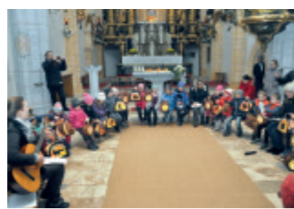
MARTINFEST des Kindergartens Möberdorf