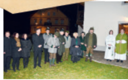
HUBERTUSMESSE in Kleinfieritz