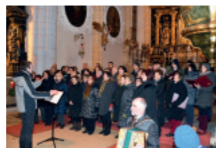
Adventsingen des Singkreises MARIA BUCH