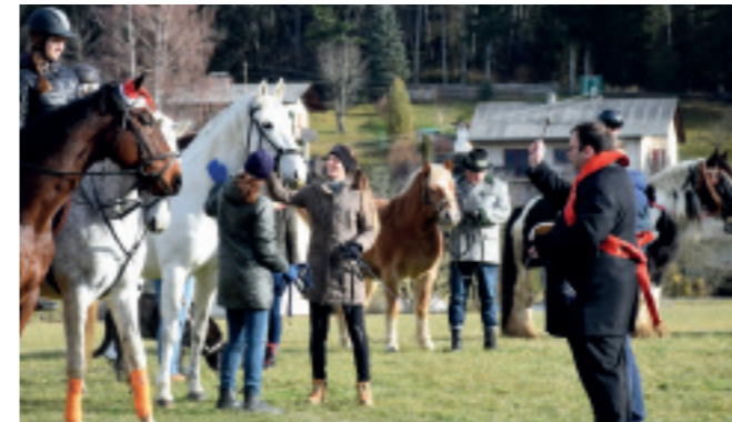
PFERDESEGNUNG in Baumkirchen