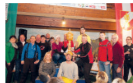
LANDESMESTER wurde die FF Weißkirchen bei den Landeswinterspielen