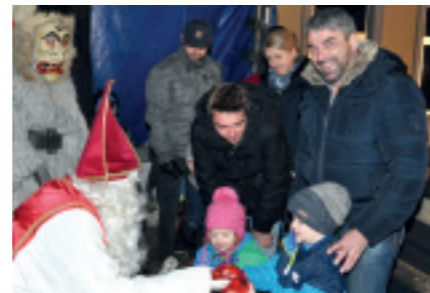
KRAMPUSTREFFEN in Weißkirchen