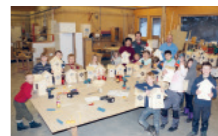
KINDERSEMESTERFERIENAKTION - Nistkastenbau