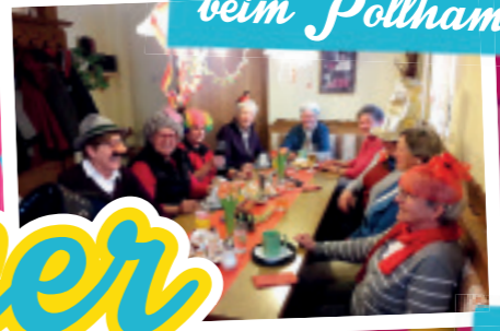
Hüttest beim Pollhamer