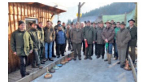
EISSCHIESSEN der Jäger in Kathal