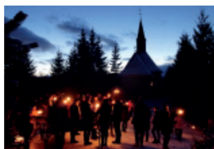
WINTERWANDERUNG auf Maxlan