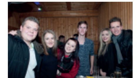
BAUERNSILVESTER in Möbersdorf