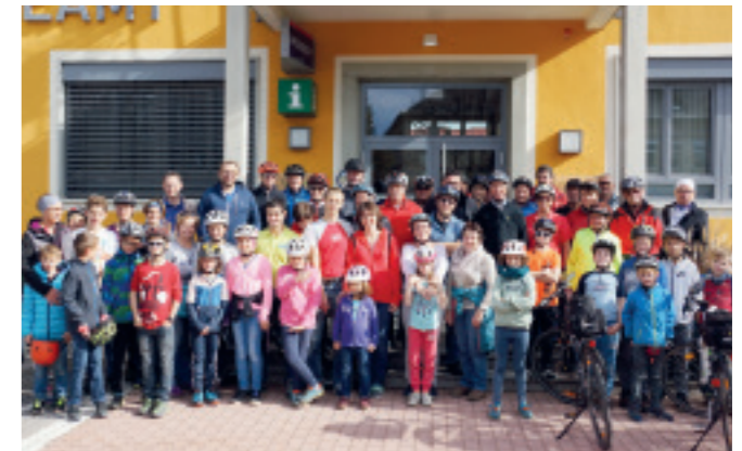
RADWANDERTAG am Nationalfeiertag