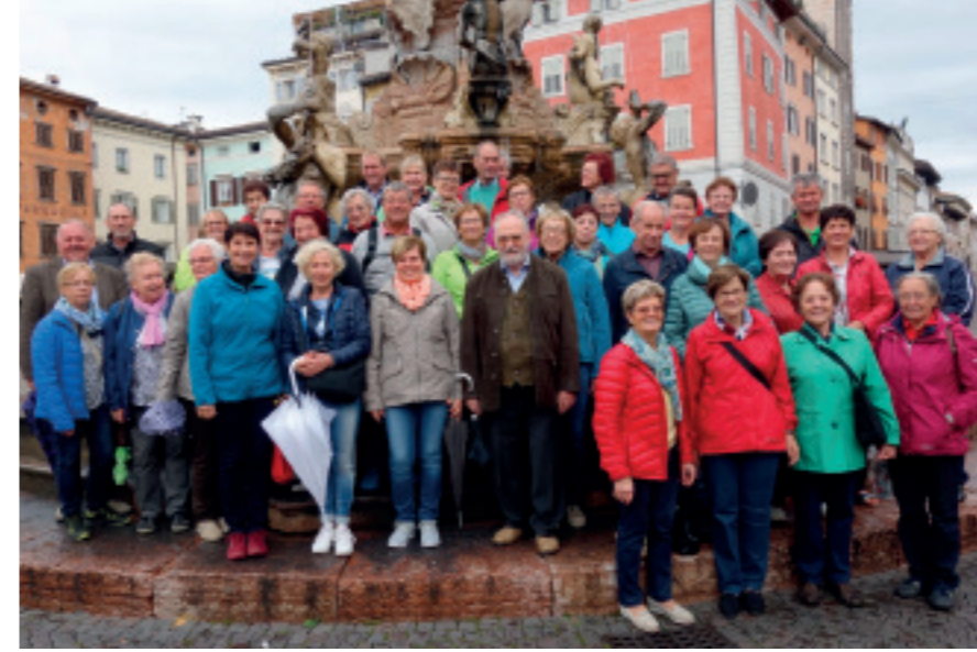
SENIORBUND WEISSKIRCHEN - Reisehöhepunkt Südtirol und Trentino