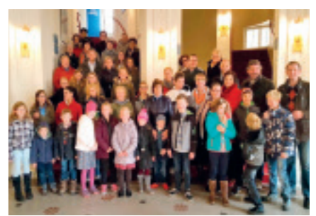
MUSICALFAHRT nach Baden bei Wien