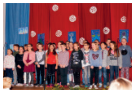
WEIHNACHTSSPIEL der VS Weißkirchen