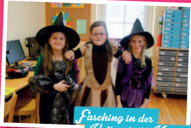
Fasching in der Volksschule Käthal