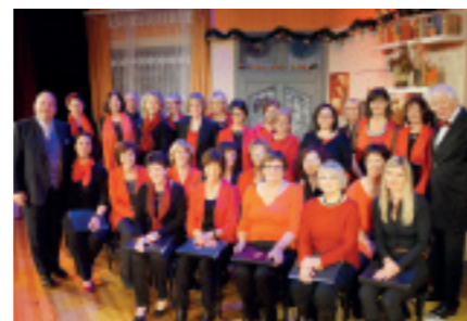
Feinklang Weißkirchen: Konzert im GLORIA-THEATER