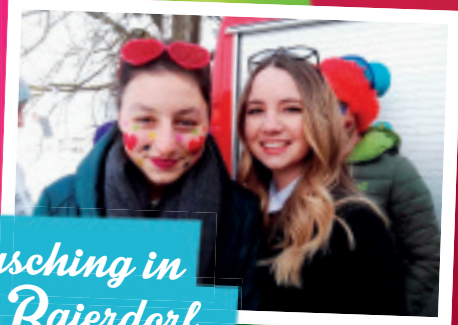
Fasching in Baierdorf