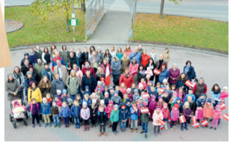
NATIONALFEIERTAG – gemeinsames Flaggenhissen unserer Kindergärten