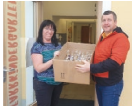
Nikolausaktion Lebenshilfe Kohlplatz