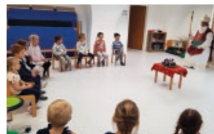
Worum es beim Nikolaus-Brauchtum tatsächlich geht, feierten unsere Kinder bei der Nikolaus-Feier im Advent und zeigten dabei ihre Freude und Dankbarkeit.

Wir sind sehr dankbar, dass trotz (freilich lästiger) Corona-Vorschriften stimmungsvolle Feierstunden möglich waren! Nochmals ein großes Danke an alle Familien für ihre Mithilfe und das gemeinsame Feiern!