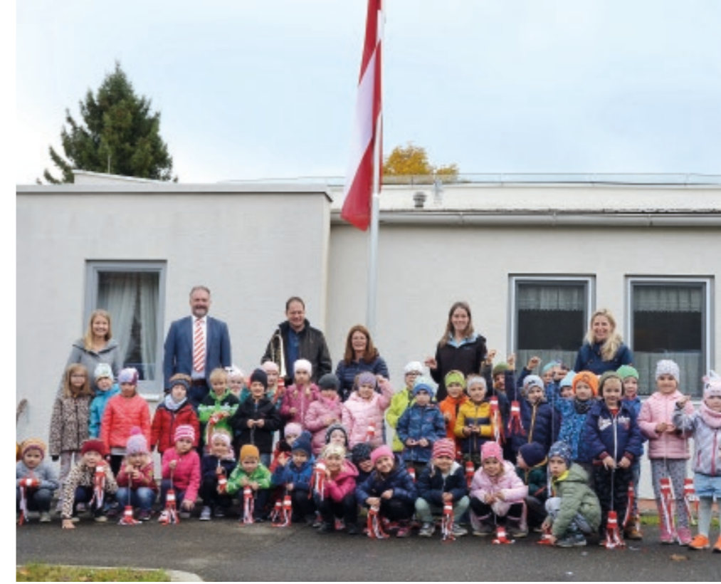
Fahnenhissen am Nationalfeiertag KIGA Möberdorf