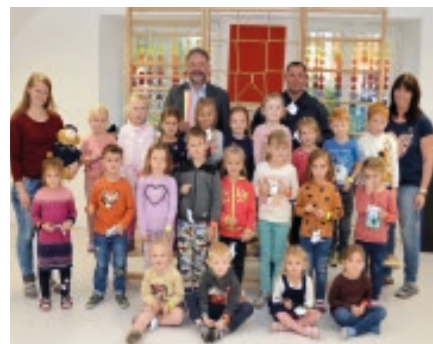
Sicherheitsbänder der Polizei für die Kinder des Pfarrkindergarten Weißkirchen