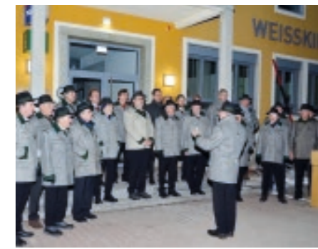
Christbaumsingen MGV Weißkirchen