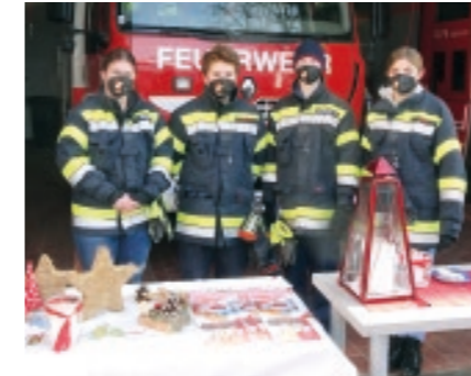
Friedenslicht Jugend FF Weißkirchen