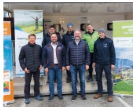
Informationsveranstaltung Clean Air Richtiges Heizen