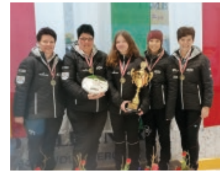
Europacup Damen ESV Großfeistritz