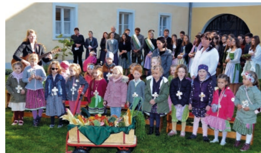
Mit den selbst gebastelten Erntedank-Kreuzen und mit begeistertem Gesang feierten wir im Pfarrgarten Erntedank. Die große Feiergemeinde hat sich mitgeföhrt!