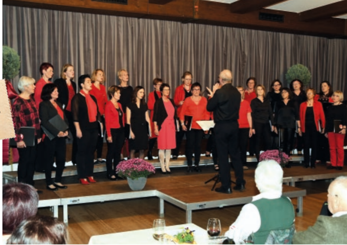
Konzert Weißkirchner Feinklang