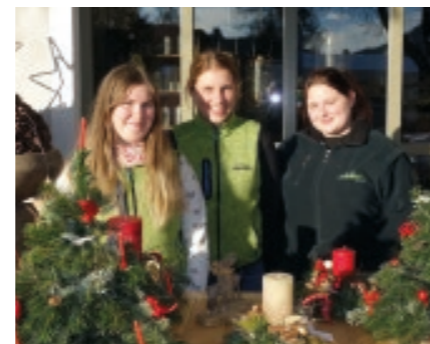
Adventstraße Weißkirchner Wirtschaftsbetriebe