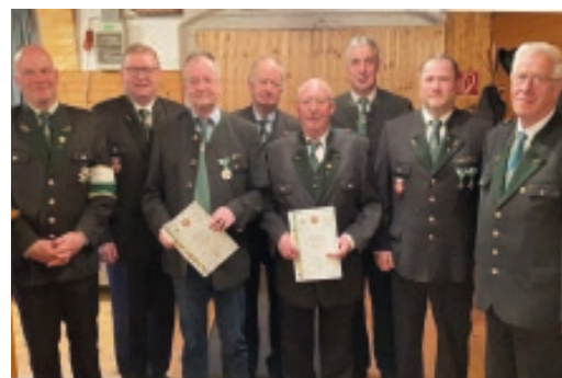
Sportlerehrung beim ÖKB Weißkirchen