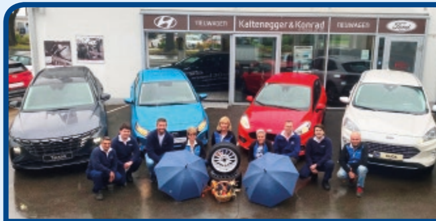
Unser kompetentes Team ist bei jedem Wetter für Sie da!

Wir nehmen uns gerne für Sie Zeit und freuen uns auf Ihren Besuch.