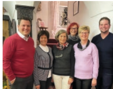
Vorstandswechsel Turnverein Weißkirchen