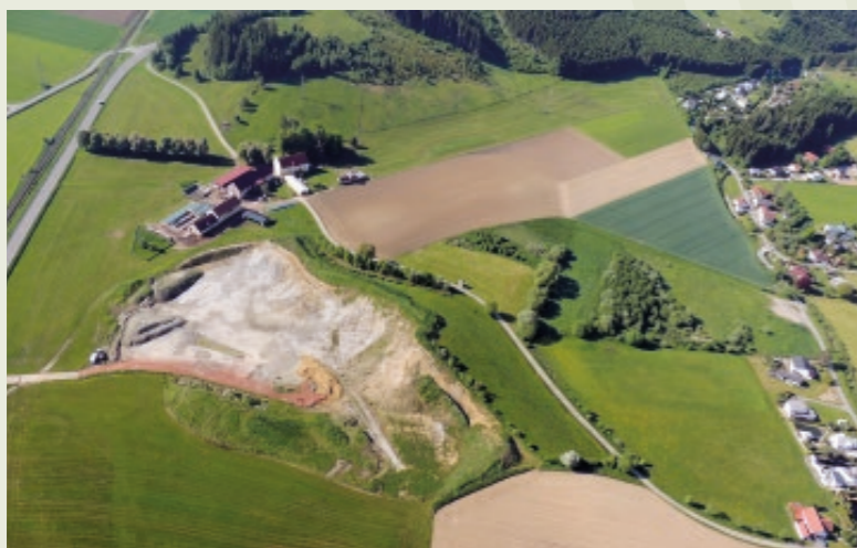
Der „Penzhügel“ wird im Sommer 2022 rekultiviert sowie die gewonnene Fläche wieder landwirtschaftlich genutzt.

... der sogenannte „ Penzhügel “ im Sommer 2022 rekultiviert wird. Nach der letztjährigen Beendigung der Tongewinnung durch die Firma Wienerberger, wird der vorhandene Abraum sowie Humus flächig aufgebracht und begrünt. Anschließend wird die Fläche wie vorgesehen wieder landwirtschaftlich genutzt.