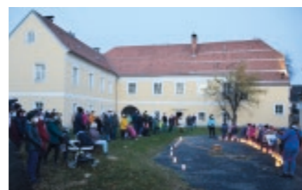
Trotz strenger Corona-Regeln konnten wir aufgrund der Unterstützung durch die Familien miteinander das Martins-Fest feiern. Danke dafür!