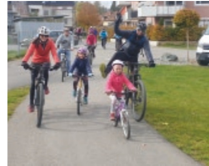
Radwanderung nach Kleinfestritz